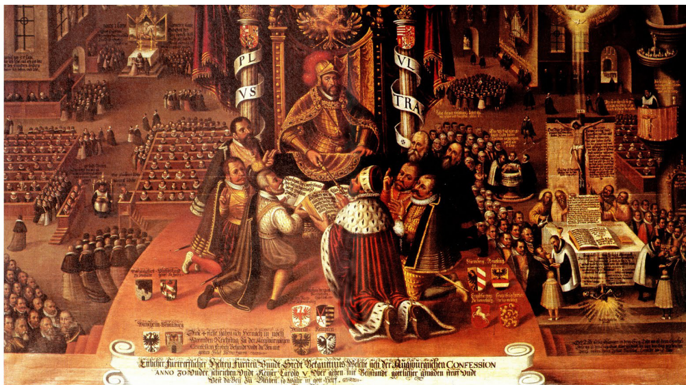
Augsburgska bekännelsen presenteras för kejsar Karl V den 25 Juni 1530. Tavlan finns i Pfarrkirche St Georg i Eisenach.